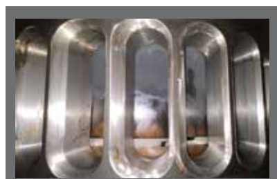
活塞顶： 只产生极少量积碳