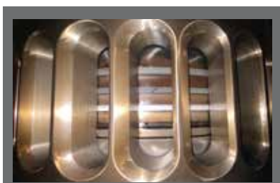
优异的活塞清洁性能